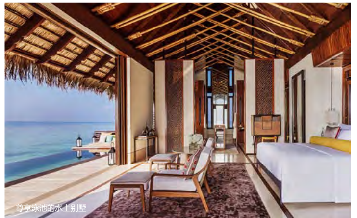
尊享泳池的水上别墅